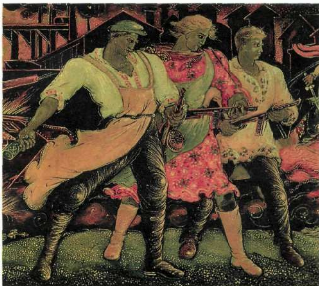
На шмуцтитулах опубликованы фрагменты миниатюр.

И.Голиков. Слово о полку Игоре Б.Ермолаев. Куликовская битва А.Куркин. Полтавский бой М.Сперанский. Бородинская битва И.Голиков. Битва красных с белыми А.Котухина. Сталинград А.Ватагин. Демонстрация в деревне