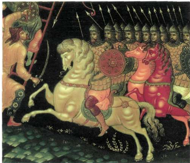
Иван СТАДНЮК. Поле славы . . . . . 8