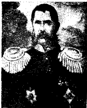
Я. П. Бакланов, походный атаман казачьих полков, герой Крымской войны.

Когда началась блокада Карса, Бакланов был назначен командиром крупного отряда, состоявшего в основном из казаков. Этот отряд должен был изучить укрепления Карса и полностью отрезать сообщения крепости с внешним миром. Избрав местом своей ставки высокую гору недалеко от Карса, Бакланов держал под постоянным наблюдением все дороги, идущие в крепость. Сам Бакланов тщательно изучал укрепления Карса, расположение батарей противника. Порой он часами рассматривал крепость в свою подзорную трубу.