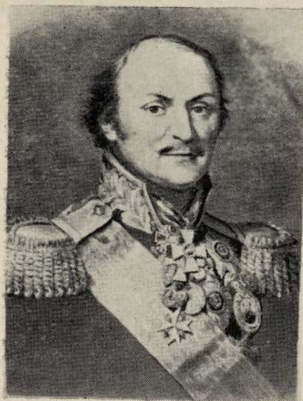
Атаман М. И. Платов.

ли приказал Платову двигаться вместе со 2-й армией Багратиона на соединение с 1-й армией, отходившей на Свенцьяны. Прикрывая отход 2-й армии, корпус Платова в арьергардных боях нанес серьезный урон частям авангарда наполеоновской армии. Крупные бои произошли у местечек Мир и Романово. Багратион приказал Платову удерживать как можно долее местечко Мир, с тем чтобы дать возможность отдохнуть утомленным войскам 2-й армии, а затем обеспечить их дальнейший отход на