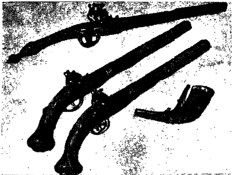
Оружие XVIII—XIX веков.

щества казаков, проводил время в их кругу, принимая участие в их играх» 1 .